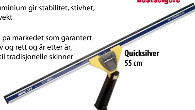
Quicksilver 55 cm