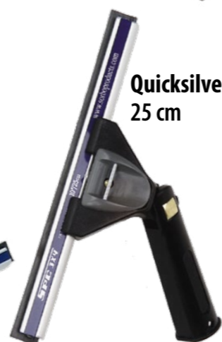
Quicksilver 25 cm