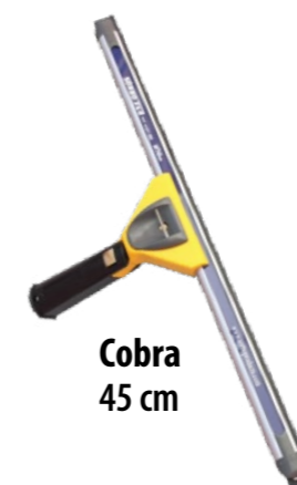
Cobra 45 cm

Med fire spor til nalgummien kan man være mer fleksibel, slik at man kan justere fastheten på nalgummien, f. eks mellom stangpuss opptil 13 meter og gatepuss. Dette gir bedre tilpasningsevne mot glasset, bedre kontroll og ytelse. For eksempel på skinner over 90 cm bruker man alltid det andre sporet for å få riktig trykk og vinkel på gummi. Les mer på siste side om hva som gjør Sörbo så unik. En annen grunn til at Sörbo har dette designet er når gummi begynner å bli slitt, kan man skjerpe den (med Sörbo Docket Trimmer) og få ny skarp gummi.