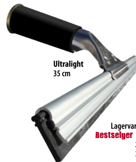
Ultralight 35 cm